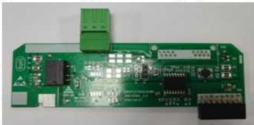
Рис. 1-1 Внешний вид TG920-CAN и TG920-MBus