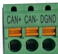
Рис. 2-1 Пример конфигурации клеммы CN6 (TG920-MBus аналогичный клеммник только с другой маркировкой)